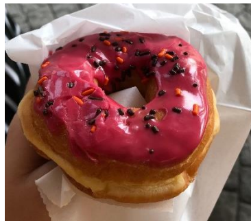
Les fameux donuts

Elle m'a aussi fait découvrir les alentours, comme NY et la plage :