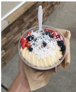
L'acai (les premiers fruits que j'ai mangés)