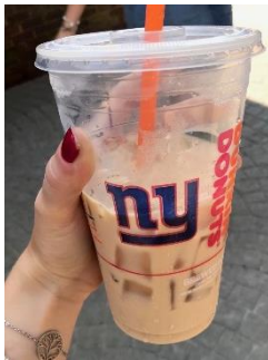
Le café glacé à la vanille

La première semaine qui a suivi mon arrivée, la student qui partait en échange était encore là, je suis contente d'avoir pu faire sa connaissance avant qu'elle parte en Italie. Elle m'a fait découvrir les spécialités culinaires américaines, qui sont encore plus grasses qu'elles en ont la réputation ! En voici quelques-unes :