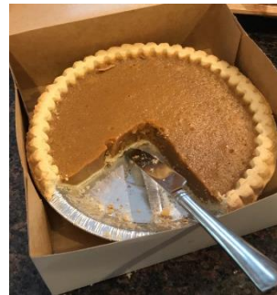
La tarte à la citrouille