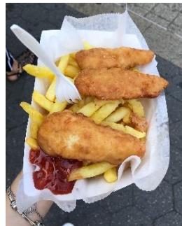
Le poulet frit